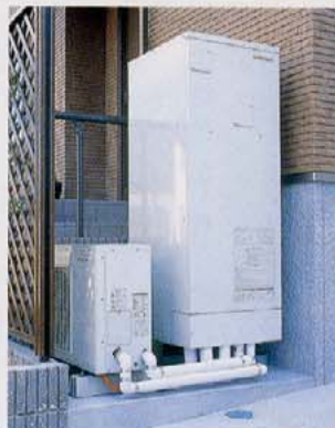
エコキュートは玄関右側に設置