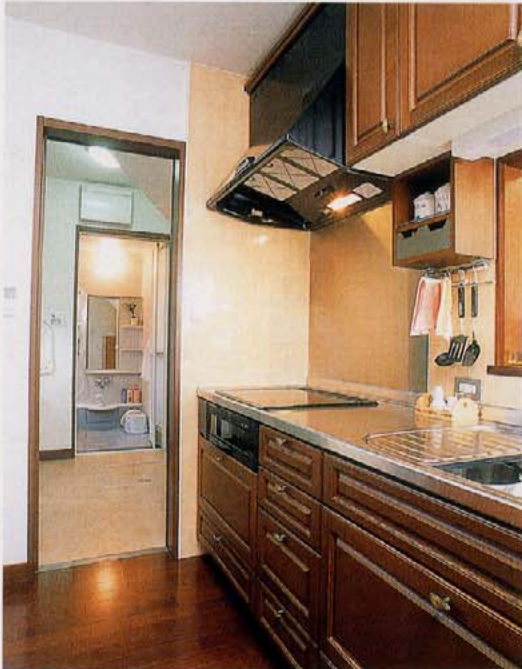
オール電化で快適なシステムキッチン